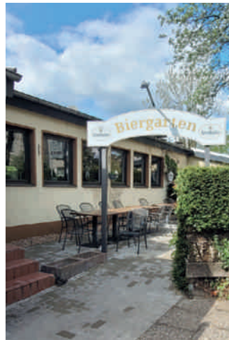
Im Eingangsbereich an der Elbeallee gelegen findet sich jetzt der ausgebaut Biergarten.