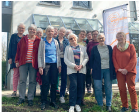
Das Team des Weltladens setzt sich unermüdlich für einen fairen Handel ein.